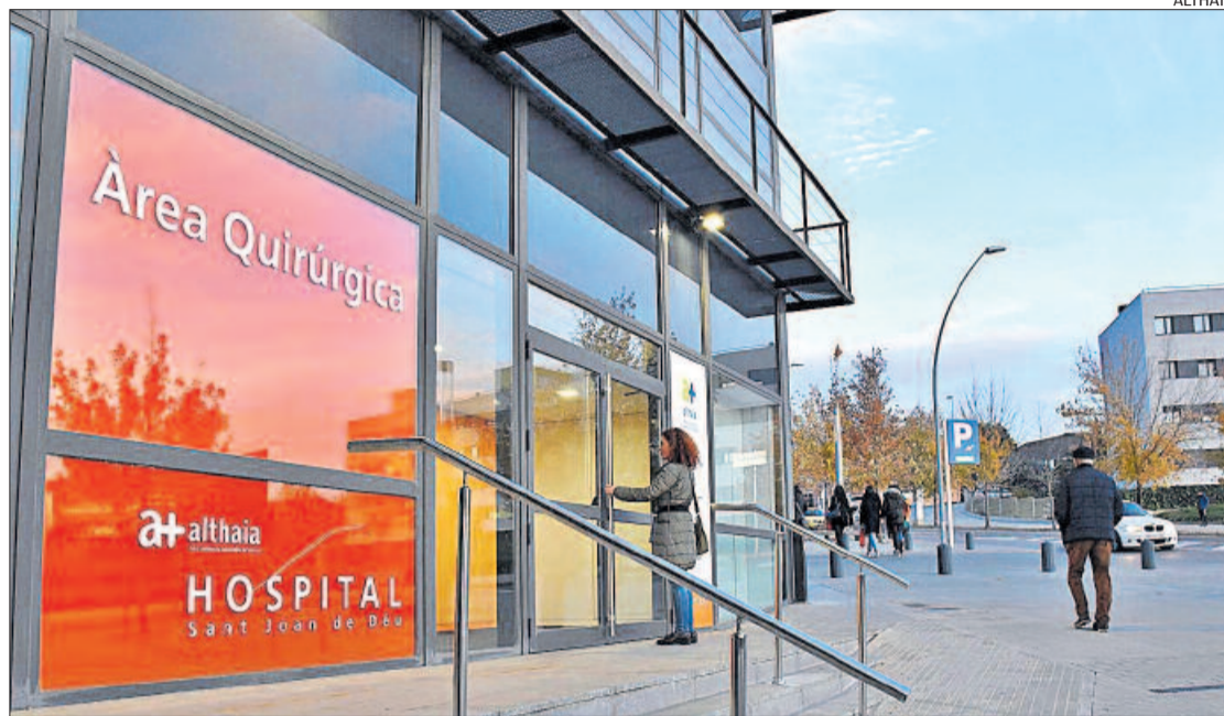
La nova entrada a l'hospital, ja senyalitzada, serà accessible des de demà dilluns

La Cirurgia Major Ambulatoria (CMA) inclou tots els processos quirúrgics, diagnòstics i terapèutics realitzats amb anestèsia general, local, regional o sedació, després dels quals la persona requereix cures postoperatòries poc intenses i de curta durada, sense necessitat d'ingrés hospitalari. Acostumen a ser processos de baixa complexitat i risc, amb tèc-